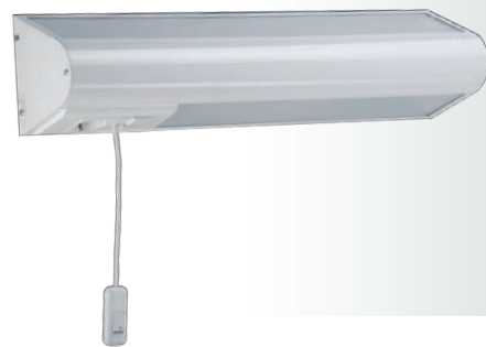
ВН 236 с кнопкой вызова (левосторонний).

Светильник комплектуется выключателем для управления индивидуальным освещением, розеткой, кнопкой вызова медицинского персонала.