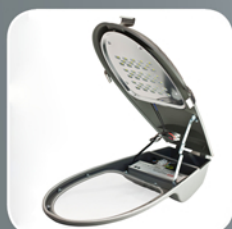
Вид светильника при обслуживании