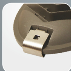
Замок из нержавеющей стали